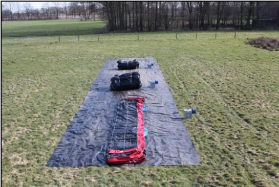
Stap 7: Rol deel 1 uit.