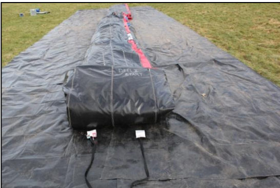
Stap 27: Leg 2 spanbanden neer.