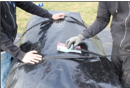
Stap 33: En span deze aan met de spanbandjes.