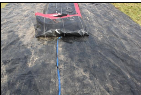
Stap 35: Til de voorkant van de stormbaan op begin bij deel 3. en leg een spanbandje neer.