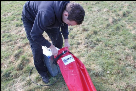
Stap 25: Sluit de blowers aan.