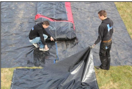
Stap 17: En leg eerst een spanbandje neer.