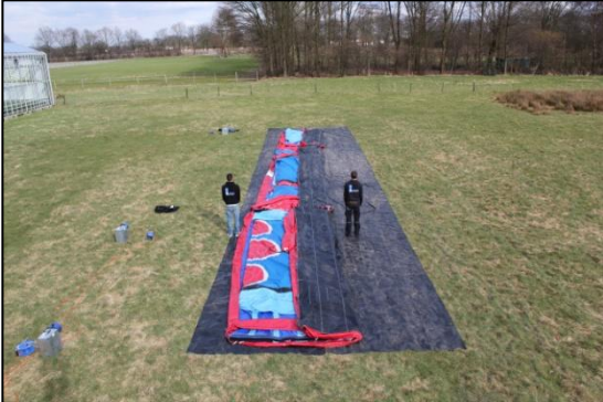
Stap 13: Herhaal dit bij alle 3 de delen.