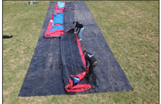
Stap 14: Vouw/trek het kussen dicht tot een mooie rechte strook.