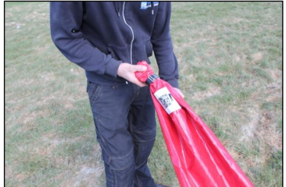
Stap 26: Sluit de luchtslang aan andere kant af.