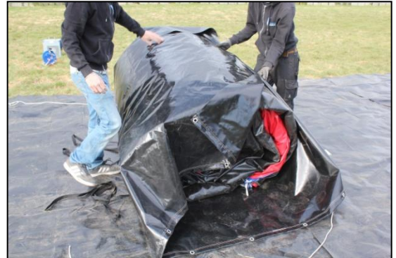
Stap 32: Vouw de transportzak dicht over het kussen.