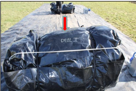
Stap 9: Neem deel 2 . en verwijder de transportzak en de spanband.