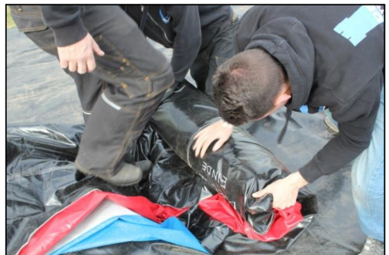
Stap 30: Rol deze zo strak mogelijk op van de achterkant na de transportzak toe.