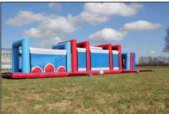
Stap 29: Veranker het luchtkussen als deze volledig is opgeblazen.