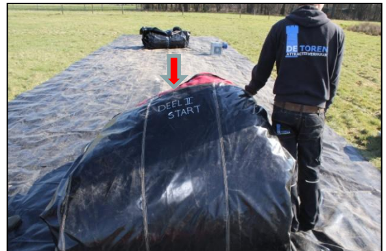
Stap 10: Als het goed is staat er deel 2 start op het kussen. Dat betekent dat het begin is van het 2 e deel. Deze word in het verlengde van deel 1 geplaatst.