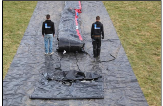
Stap 26: Til de voorkant van de stormbaan op begin bij deel 2.