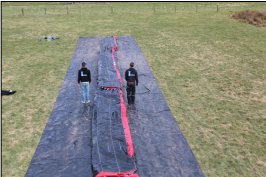
Stap 15: Herhaal de bij alle 3 de delen.