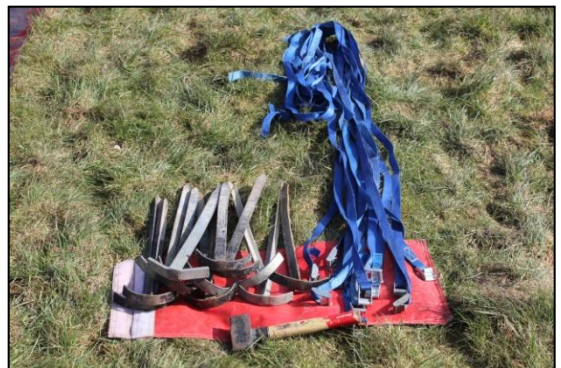
Stap 30: De verankeringsset bestaat uit min. 12 haringen 12 spanbandjes en een hamer.