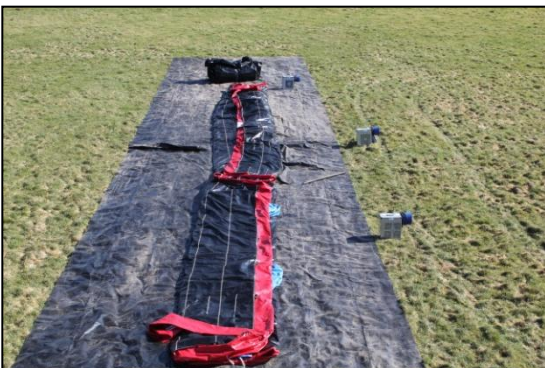
Stap 11: Rol deel 2 uit.