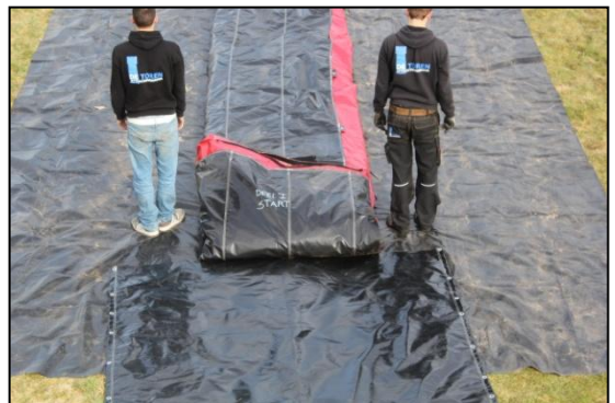
Stap 18: Leg op het spanbandje de transportzak tegen het kussen aan.