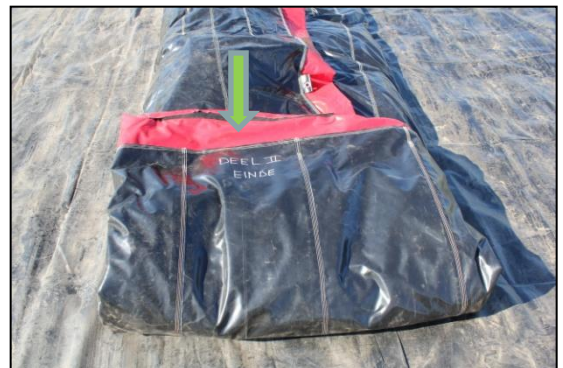
Stap 12: Aan het einde van deel 2 staat deel 2 einde . Aan deel 2 einde, word deel 3 start gekoppeld.