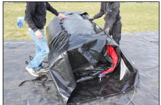
Stap 34: Rijg het touw door de ogen van de transportzak vast. En trek deze aan.