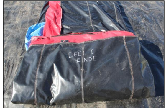
Stap 8: Aan het einde van deel 1 staat deel 1 einde . Aan deel 1 einde, word deel 2 start gekoppeld.