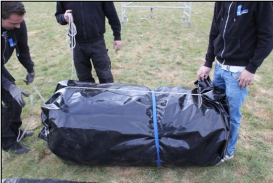
Stap 25: Klaar voor transport