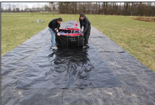
Stap 29: Vouw het kussen terug. Deze ligt nu deels op de transportzak.