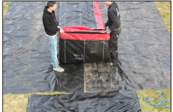
Stap 16: Til de voorkant van de stormbaan op begin bij deel 1.