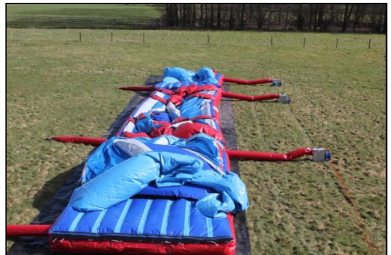
Stap 28: Het luchtkussen vult zich met lucht.