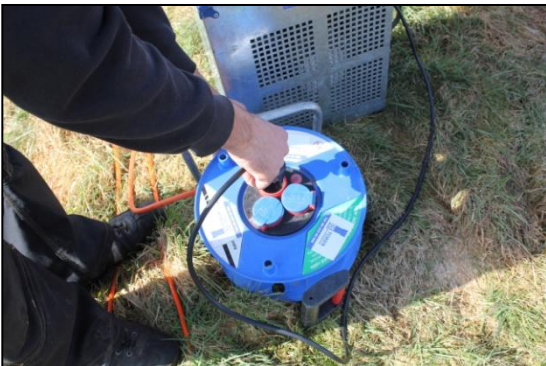
Stap 27: Steek de stekker in de geaarde en afgerolde haspel. En herhaal dit bij alle 3 de blowers.