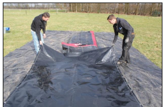
Stap 36: leg de transportzak op het spanbandje tegen het luchtkussen aan. En sla het kussen terug zodat het op de transportzak ligt.