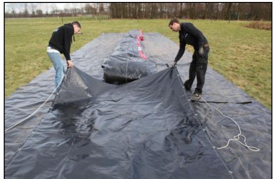
Stap 28: Leg de transportzak op de spanbanden tegen het kussen aan.