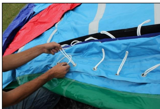
Stap 12: De rijgtouwjes dicht rijgen.