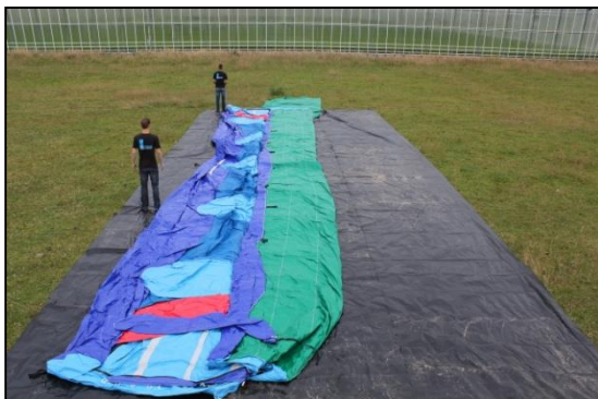
Stap 9: Linkerkant is klaar.