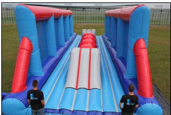
Stap 17: Kussen is vol met lucht en klaar voor te verankeren