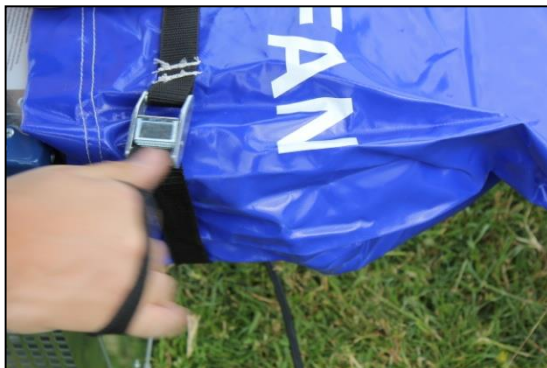
Stap 14: Trek spanband stevig vast om mond van de blower.