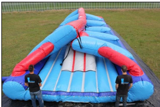
Stap 16: Luchtkussen vult zich met lucht.