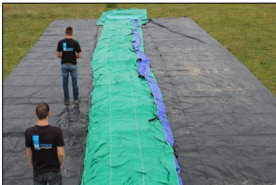
Stap 7: Luchtkussen in een rechte baan trekken.