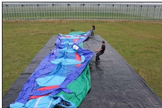
Stap 10: Rechterkant open vouwen.