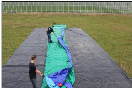
Stap 8: Van links naar rechts open vouwen.