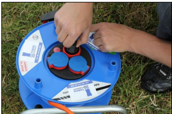
Stap 15; Steek de stekker in de geaarde en afgerolde haspel.