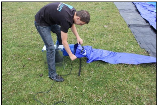
Stap 13: Sluit blower aan op luchtslang.