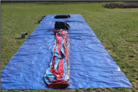
Stap 7: Rol het luchtkussen uit.