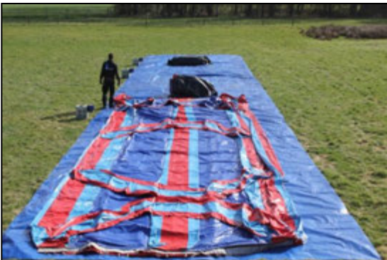
Stap 9: Plaats luchtkussen deel 2 start tegen het einde van luchtkussen deel 1.