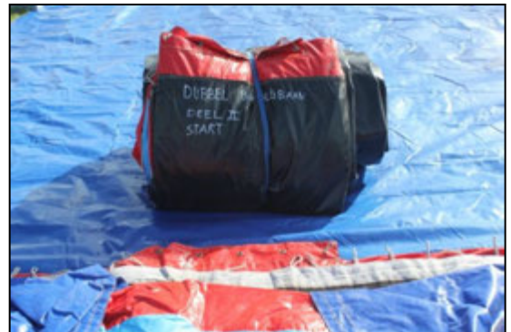
Stap 10: Verwijder transportzak.