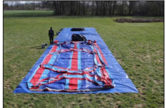
Stap 8: Vouw het luchtkussen open.