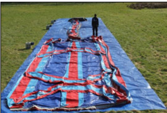
Stap 11: Rol het luchtkussen uit vanaf start deel 2.