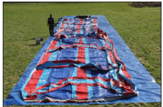
Stap 12: Vouw het luchtkussen open.