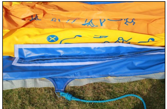
Stap 10: De luchtgaten worden door middel van een ritsluiting afgesloten.