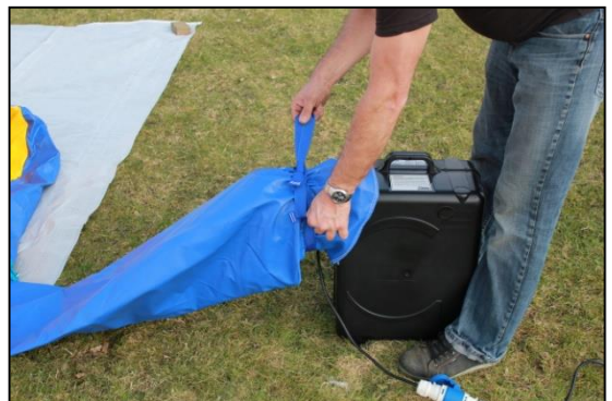
Stap 12: Sluit de blower aan. En sluit aan de andere zijde de luchtslang af.