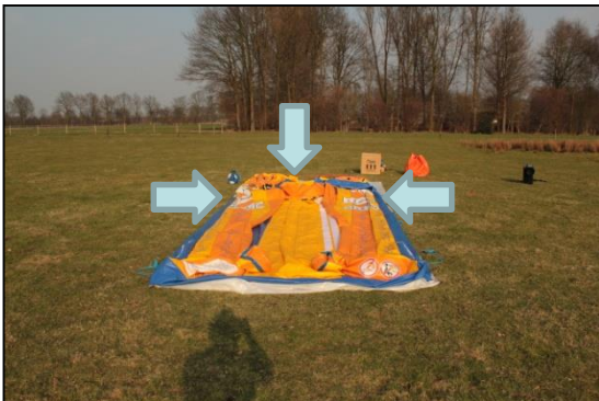
Stap 9: Sluit nu alle luchtgaten. De luchtgaten zijn aangegeven met pijlen.