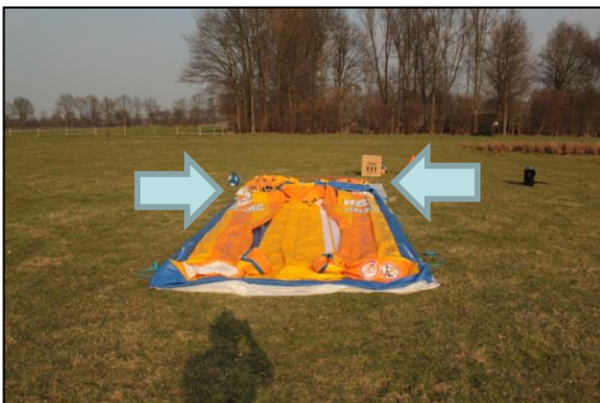
Stap 11: Kies een kant voor de blower met de pijlen wordt aangegeven welke kant de blowers geplaatst kunnen worden.