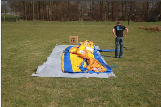
Stap 7: Vouw het kussen open.