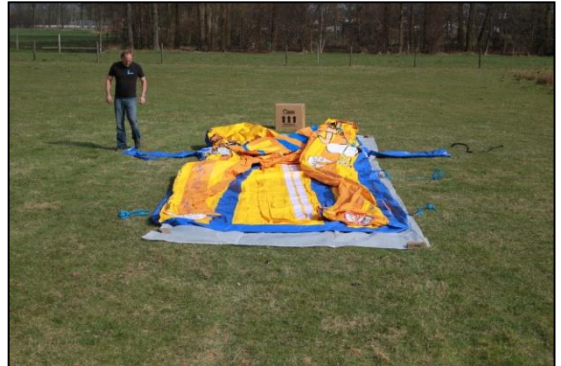
Stap 8: Vouw het kussen helemaal open.